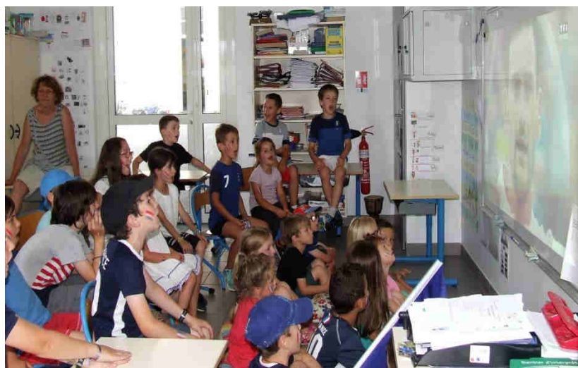
Grande concentration des enfants devant le match