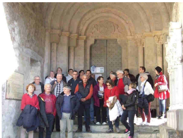
moins physique la visite de l'église