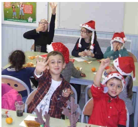
Les enfants profitant du goûter offert par l'association Les crêpes : quel succès !