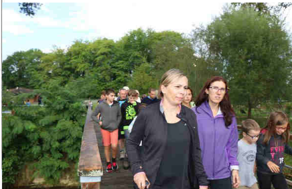
Les marcheurs nombreux au RDV