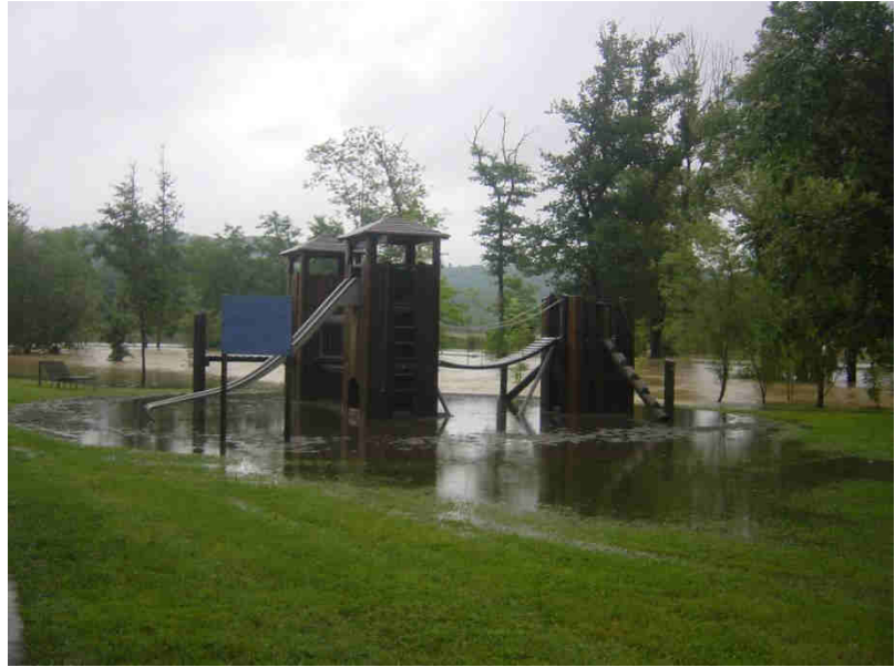
Baringouste sous les eaux

Aucun dégât à déplorer sur les habitations, fort heureusement, juste les désagréments au niveau de la circulation et ces quelques photos souvenirs !