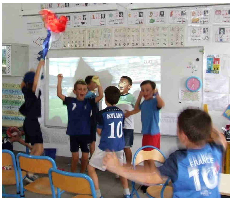
L'explosion de joie et la délivrance après les buts de Raphael Varane et d'Antoine Griezman