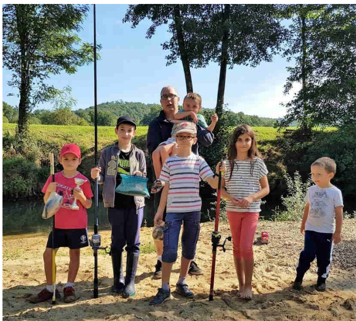
Belle brochette de nos pêcheurs en herbe