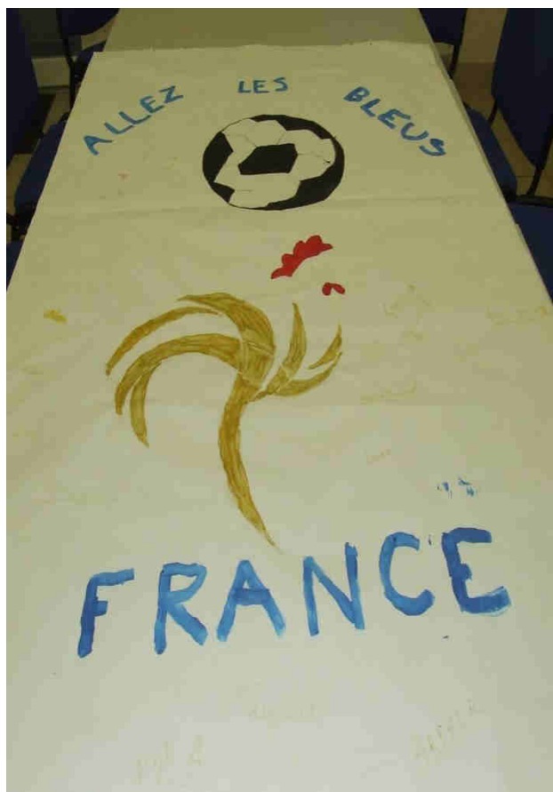
Réalisation d'une affiche dans le cadre des activités périscolaires pour encourager l'équipe de France.