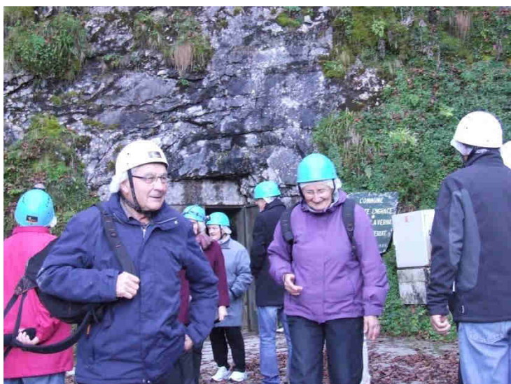
Une partie d'un groupe à la sortie de la Grotte

La fameuse expédition souterraine vers la salle de la Verna pour les autres