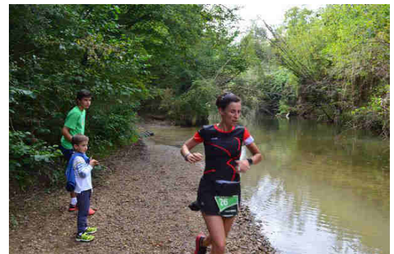
Les locaux encouragés le long du parcours