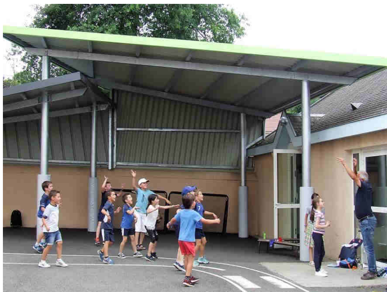
Moment de détente à la mi-temps avec une partie de foot (encore !) improvisée avec M. le Maire.