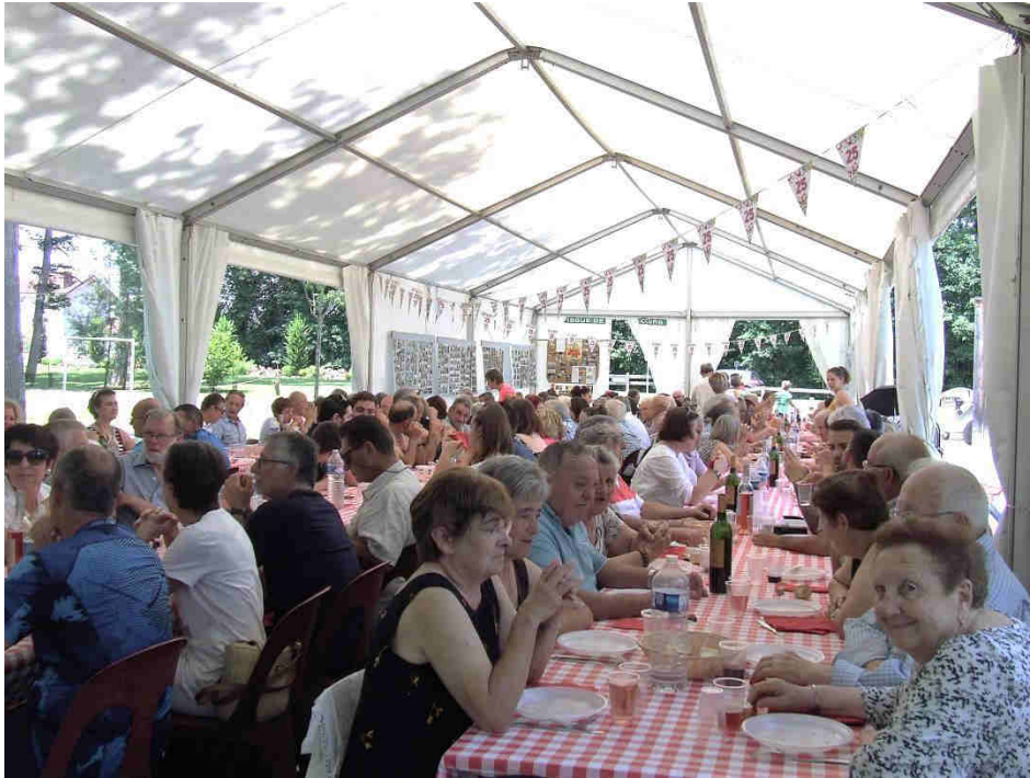
170 convives étaient réunis pour l'occasion